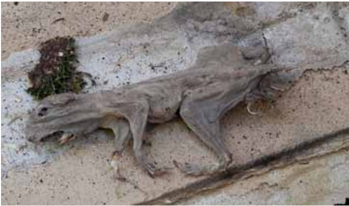
Selinin majaa purettaessa löytyi myös oheinen olento vuosien takaa. Tarkemmassa tarkastelussa se paljastui mummioituneeksi oravaksi. Oikealla on maja valmiina.