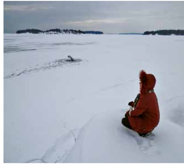
Talvikalastajat ovat tehneet avannon jäähän ja luultavasti joku muu lumiukon rantaan.