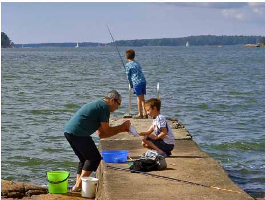
Zuccaron pojat saunan laiturilla.

ihaili komeita saaliita ja seurasi vaa'an näyttämiä lukemia.