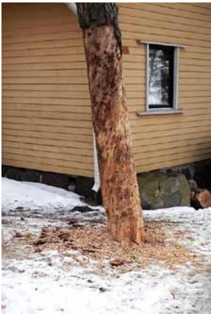
Saunan viereinen laho puu oli kaadettava, varsinkin kun ilmeisesti palokärki oli ehtinyt kevättalvesta hakata jälkensä sen alaosaan. Kuva: Tuomo Honkanen.

Satakieli pysyy mielellään piilossa, mutta joskus senkin pääsee näkemään. Helpointa sen näkeminen on toukokuussa, kun puiden lehdet eivät vielä ole täydessä vehreydessään ja kasvustojen sisään näkee. Kuva: Tuomo Honkanen.