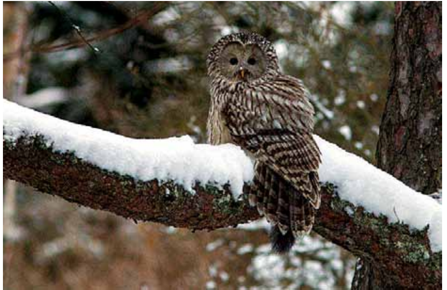
Viirupöllöjä havaitaan aika ajoin Länsiulapanniemelläkin.