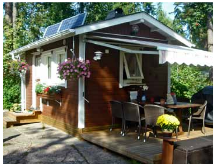
Sarjon maja (222) sai runsaat eristeet, jotta lämpö pystyy pidempään sisällä. Myös keittiön omistaja suunnitteli itse palvelemaan parhaalla tavalla vieraiden kestitsemistä.