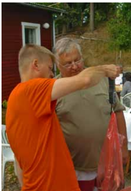
Yhdistyksen puheenjohtajan tehtävät ovat moninaiset – eikä pidä väheksyä kunniatehtäviä, kuten ongintakilpailun virallisena mittaajana toimimista.

Kevättalvella oli perinteinen ulkoilupäivä Kesäkodilla ja saunalla. Hyvä sää sai ihmiset tulemaan sankoin joukoin paikalle ja nauttimaan keväästä. Kohta jo saisi rapsuttaa kukkapenkkiä, ajatteli moni. Vuosikokous pidettiin huhtikuussa 24 henkilön voimin. Eniten kokouksessa puhutti mahdollisuus rakentaa lehtikomposti. Hallitukselle annettiin tähän valtuudet, mutta kompostia ei ole vieläkään tehty, koska edelleen arvioi-