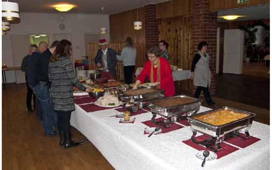
Joulupöytä oli katettu kanttiin puolelle, ja kyllä se pöytä notkuikin jouluherkujen painosta. Graavisiiika sai erityisesti kehuja.

Yhdistyksemme pikkujouluja juhliittiin Kesäkodilla 25.11.2012. Perinteiseen tapaan katettu joulupöytä ruokki juhla-joukon, ja puheensorina täytti Kesäkodin jouluisaksi koristetun ison salin. Jälleen saatiin nauttia myös joulumusiikista, tällä kertaa harpun säästykellä. Pukkikin ehti muilta kiireiltään piipah-tamaan ja jakamaan lahjat lapsille ja lapsenmielisille.