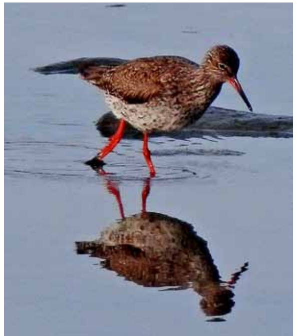
Lauttasaaren rannoilla voi havaita kahlaajia, esimerkiksi punajalka- ja valkovikloja tai rantasipejää, vaikka ne eivät laskekaan tarkkailijaa yhtä lähelle kuin pihalinnut. Punajalkaviklon kuvasi Tuomo Honkanen.