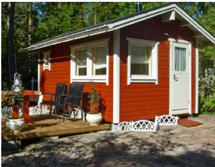
Rädyn maja (259) nousi pystyyn osittain jo talvella 2012–2013, mutta viimeiset silaukset maja ja piha saivat kesän aikana.